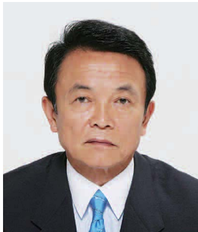
麻生太郎内閣総理大臣

三十九回追悼式に当たり、先の大戦による戦没船員をはじめ、殉職船員の方々の御霊に対し、謹んで追悼の誠を捧げます。