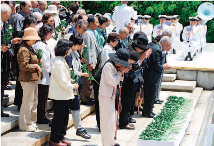
慰霊碑に向かい献花する参加者