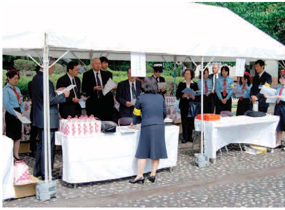
最終打ち合わせをする実行委員

追悼式は、当会役職員に加え、約三十人の実行委員の協力により運営されています。実行委員からのお便りを紹介します。