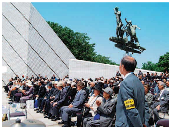
追悼式典会場の参列者

現実には直面したとき、生死の別れの残酷さに打ちのめされる思いをしたあの日が、まるで昨日の出来事のようになり、眼前に蘇り、私の心を締め付けました。もし私もあの瞬間に彼等と運命を共にしていたならば、今こうして追悼式を執り行ってくれること