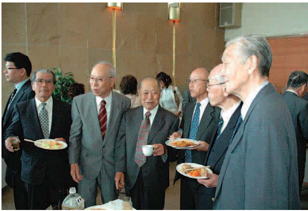
懇親会 式典終了後観音崎京急ホテルで語り合う参列者

戦没者の方が六万余人とのことです。日本は戦後六十四年過ぎておりますが、それ以降、日本はだれ一人として戦争で亡くなった人はいない、世界でも稀有なことです。平和は民族の我々の悲願としてこれからは守っていかねばと思っております。同時に我が国は海に囲まれておりませんが、大きな海難が起こっております、しかし、三千名という殉職船