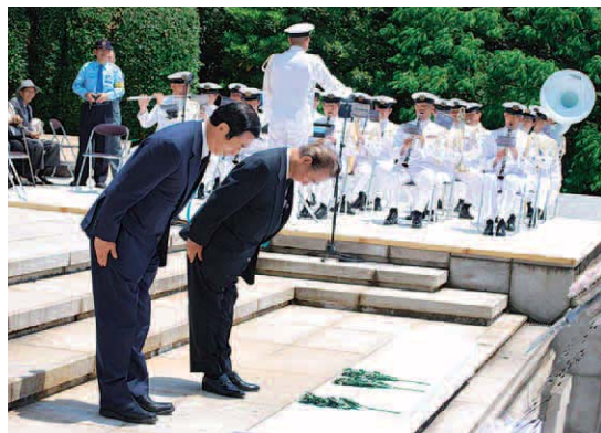
献花する中馬弘毅衆議院議員 (右) 高木義明衆議院議員 (左)

目の前にここ観音崎から見下ろせる海は正に平和の日本です。戦没船員の方がた、また殉職船員の方がたの尊い犠牲の上に今の平和があると改めて感じますと共に、二度と過ちを犯さない平和な安全の海を守り、