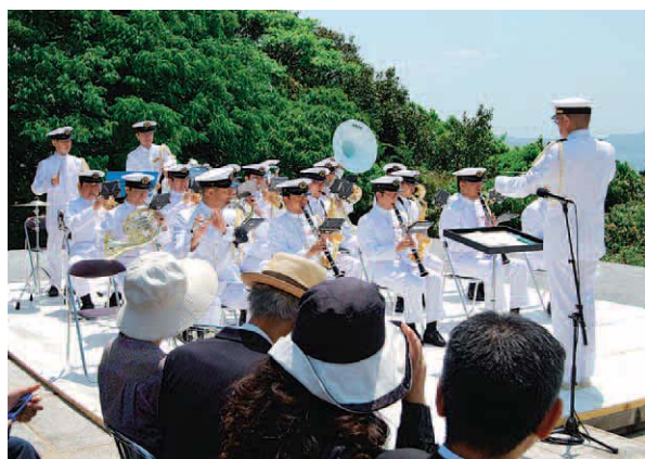
海上自衛隊横須賀音楽隊

現実には直面したとき、生死の別れの残酷さに打ちのめされる思いをしたあの日が、まるで昨日の出来事のようになり、眼前に蘇り、私の心を締め付けました。もし私もあの瞬間に彼等と運命を共にしていたならば、今こうして追悼式を執り行ってくれること