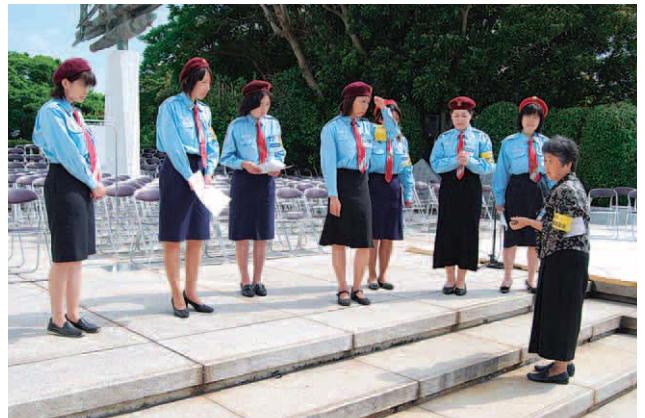
献花する白菊の配り方を確認する実行委員