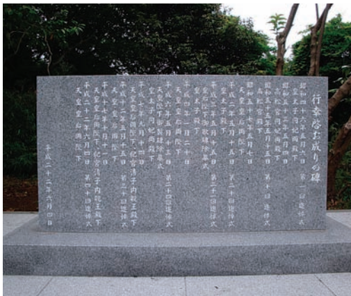
行幸啓お成りの碑

小中学生の頃、母は話しながらなかつたのですが、祖母は孫なので、僕には「こうして亡くなった」とよく話していました。「船長をしていたので、他の人は逃げた」と聞いています。