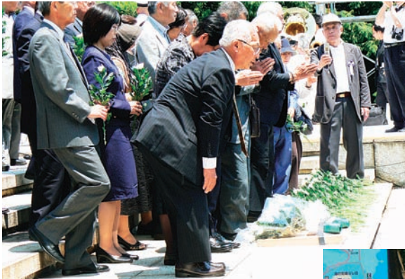
全員献花する参列者