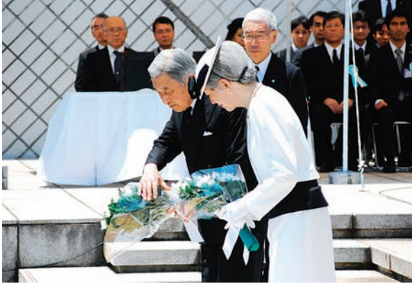
ご供花される両陛下

6月4日、神奈川県横須賀市観音崎公園内の「戦没船員の碑」で、第40回戦没・殉職船員追悼式が行われた。節目に当たる今年には、戦没・殉職船員のご遺族の長年の労苦に応えるため、天皇皇后両陛下の行幸啓を賜った。式典はご遺族、船員OB、海事関係者等約800名が見守る中、天皇皇后両陛下により