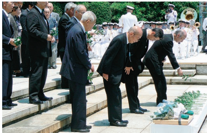
全員献花する参列者

小生は8年前より、会場付近の交通整理担当として参加させて頂いております。参加1回目の時は、マイククロバスの乗下車時に踏み台がなく、年配の方がソロソロりと行動