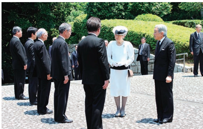
お出迎え者にご挨拶の両陛下