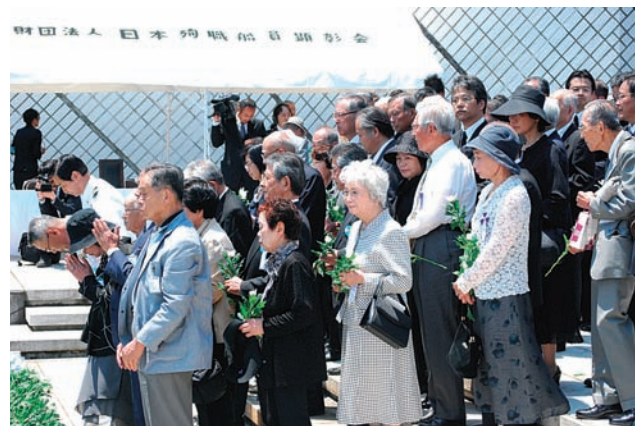
全員献花する参列者

頭の下がる思いで、スタッフとしてお手伝い出来ることに感謝申し上げます。また、最近の参拝者にマイククロバスからスイスイと乗下車される方が増えたと感じております。おそらく遺族の方のご子息、お孫さん並びに関係者と思えますが、若い方が6万数千人の御霊の追悼に参加し、引き継がれることと思えます。