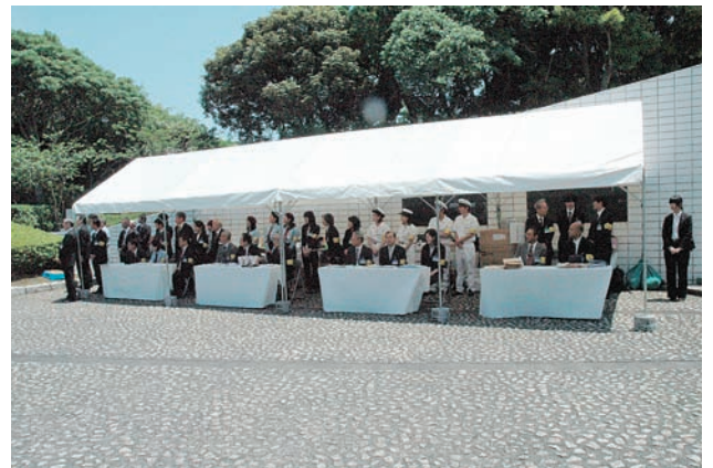
両陛下の御着を待つ実行委員

での方、毎年必ずご出席なさっている方など、追悼式をとて大切に思ってお出でになられてる事を感じ、微力ながらそのお手伝いができ良かったです。