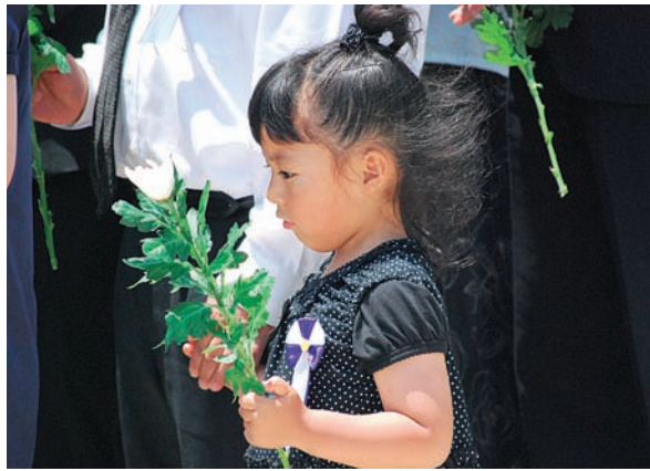
私も一緒に献花する

もまして、ご遺族の方は、この式典を心待ちにしているのを感じます。今回は懇親会には参加できませんでしたが、ご遺族の胸に付けられた名札で「亡き人、船」を偲んでいる人が多かったのではないのでしょうか。少しでもお手伝いできたことが良かったと思っております。本当に関係者の皆様お疲れ様でした。